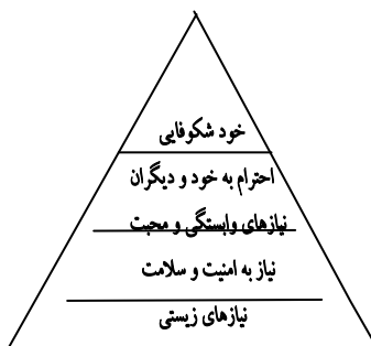
شکل ۱- سلسله مراتب نیازها از نظر مازلو

«مازلو» ۲ سلسله مراتبی از نیازهای افراد را که می‌تواند در درک نیازهای هیجانی و اجتماعی تیزهوشان و مستعدین برای نیل به رشد متناسب مفید باشد را ترسیم کرده است. (شکل شماره ۱) وی پس از «نیازهای زیستی» ۳ (هوا، آب، غذا، پناهگاه و خواب) به دومین سطح از نیازها که همانا «امنیت و سلامت» ۴ است توجه داشته است. سومین مرحله به نیازهای «محبت و تعلق داشتن» ۵ اختصاص دارد و چهارمین سطح نیازها «احساس احترام به خود و احترام به دیگران» ۶ است. «خود شکوفایی» ۷ به عنوان بالاترین سطح شامل رشد تمامی نیازها است.